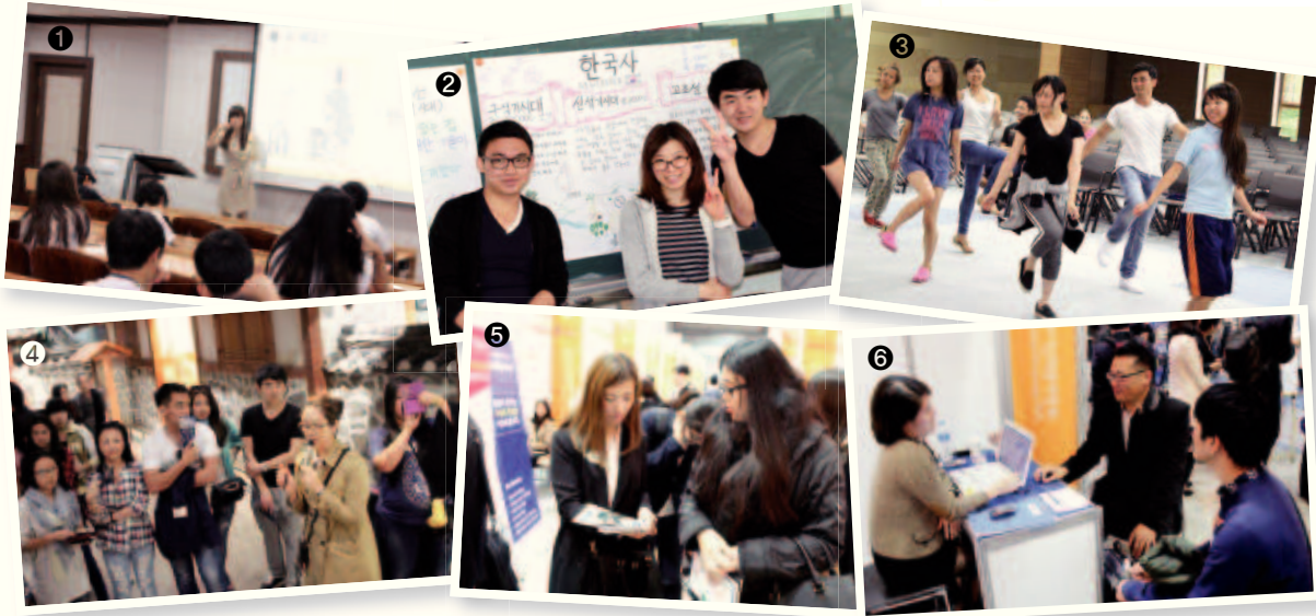
재외동포 모국수학교육과정 운영 관련 사진 자료

① 한국어 수업, ② 한국사 수업, ③ 한국문화 수업, ④ 현장학습, ⑤ 취업특강, ⑥ 취업박람회 참가